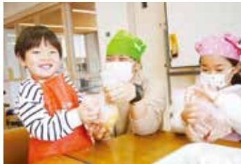
▲具材を袋に入れて混ぜ合わせる参加者

同農園は生産者と消費者が互いの立場を超えて交流を深めることを目的に 1995 年から始まりました。次世代への食農教育の一助を担い、今までの累計参加者は延べ 8880 人に及びます。令和 7 年度は 5 月から 11 月までの月に 2 回、消費者自らが農作業を行い地産地消を体験しました。この日は災害時に役立つポリ袋を用いた「防災食」と当農園で収穫された大豆を使った「豆腐作り」に挑戦。防災食ではお湯ポチャレシピを参考にし、少量の水だけで調理をする炊飯器を使わないご飯の炊き方や、煮込みハンバーグ作りに取り組みました。参加者たちは協力しながら具材を切ったりするなど有事の際に備えた学びを深めました。昼食には出来上がった防災食や、豆腐、女性部員たちが作ったキノコ汁を食べたりしたほか、来年度のふれあい農園で作りたい野菜などをグループごとに発表しました。参加者の一組は「いつ災害が起きるかわからない中で、防災食作りを学べたことは万が一の際に役に立つのでいい機会になった」と話しました。内田信一代表理事専務理事は「交流会を通して 1 年間の体験を振り返る機会にして欲しい。この活動が子どもたちにとって食や農業を学ぶきっかけになれば」と述べました。