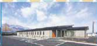
JA虹のホールあずさがわ 松本市梓川楼702-4 TEL 0263-78-1050