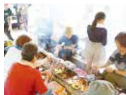
▲バーベキューをしました