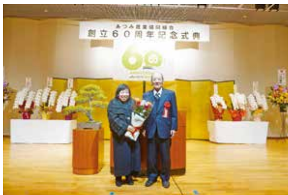
▲58年前、日本所で挙式を挙げた折野さんご夫妻