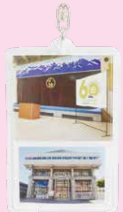
▲60周年記念 キーホルダー(表)