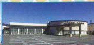
JA虹のホールとよしな 安曇野市豊科886 TEL 0263-73-6845