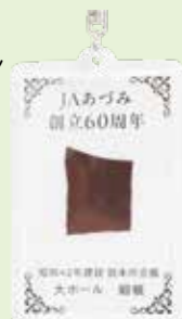
▲60周年記念 キーホルダー(裏)

【価 格】 500円(税込) 【販 売 場 所】 JAあづみ総務課 安曇野市豊科4270-6 【お問い合わせ】 TEL.0263-72-2930