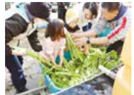
▲野沢菜を洗う参加者