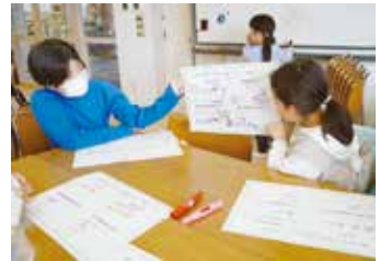
▲ワークショップを行いました