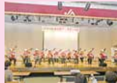
▲シャベラーズ26による演奏