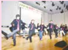
▲西穂高支部の活動発表と東京ブギウギのダンスを披露