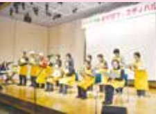
▲北穂高支部の活動発表と童謡唱歌の披露